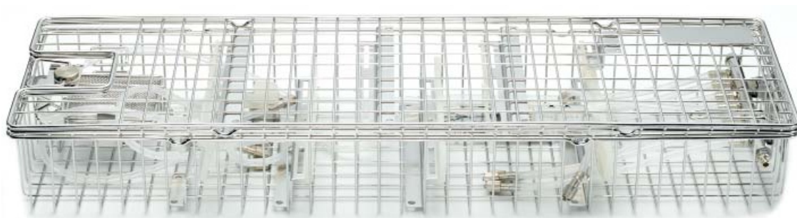
Kosz do czyszczenia z pokrywą; oferuje bezpieczną ochronę dla wrażliwych części endoskopu podczas czyszczenia, sterylizowania, przechowania lub transportu z obturatorem

* Pojedyncze elementy są możliwe do kupienia dopiero po uprzednim zakupieniu zestawu UMP o nr (Katalogowym 41.0665a) oraz na żądanie. 41.0676a*